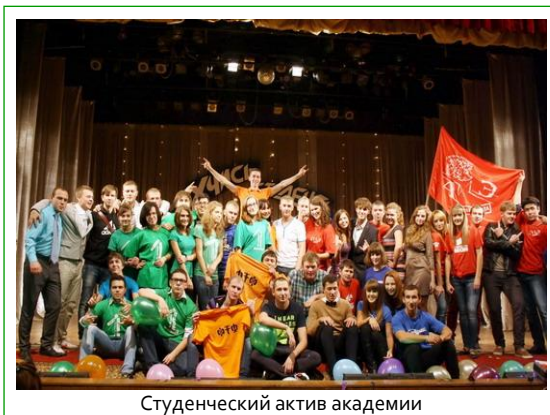
Студенческий актив академии