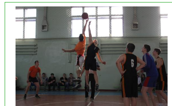
Спортивный зал академии

В учебном расписании предусмотрен часовой перерыв на обед. В основных корпусах академии работают столовые, торговые автоматы с горячими напитками.