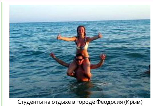
Студенты на отдыхе в городе Феодосия (Крым)

Поддерживается деятельность студенческих коллективов: клуба программистов, отряда охраны правопорядка, пожарно-спасательного отряда, команд КВН, танцевальных коллективов.